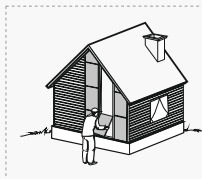
УТЕПЛЕНИЕ ФАСАДА ПОД САЙДИНГ

* Расширенный ассортимент базальтового утеплителя Hotrock Вент Лайт включает плиты толщиной от 50 – 200 мм с шагом в 10 мм.